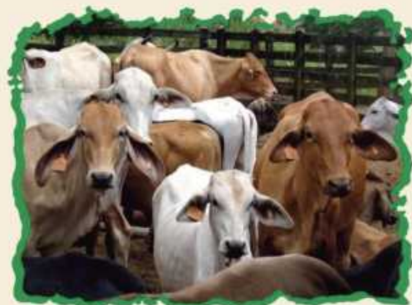
Ganado identificado para la trazabilidad, comunidad La Flor, El Almendro, Río San Juan

Pero además de ponerles las "chapas" al ganado, debemos registrar las BUENAS PRÁCTICAS PECUARIAS que hacemos en la finca.